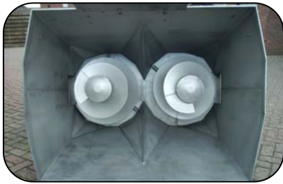
Mengvoerbak met 2 wormen

De BAVO mengvoerbak is speciaal ontwikkeld om met een kniklader meerdere producten in één werkgang te mengen en te doseren. Door de speciale vorm van de bak en worm mengt de bak zeer snel en wordt een luchtig en homogeen mengsel verkregen. Met de mengvoerbak kunnen verschillende producten worden gemengd b.v.: snijmaïs, stro, luzerne, brok, etc. Afhankelijk van de toepassing en breedte wordt de mengbak uitgerust met één of meerdere staande wormen.